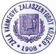
Zala Megyei Levéltár