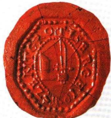
Zala Megyei Levéltár