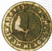
Magyar Országos Levéltár (MOL-V-5)