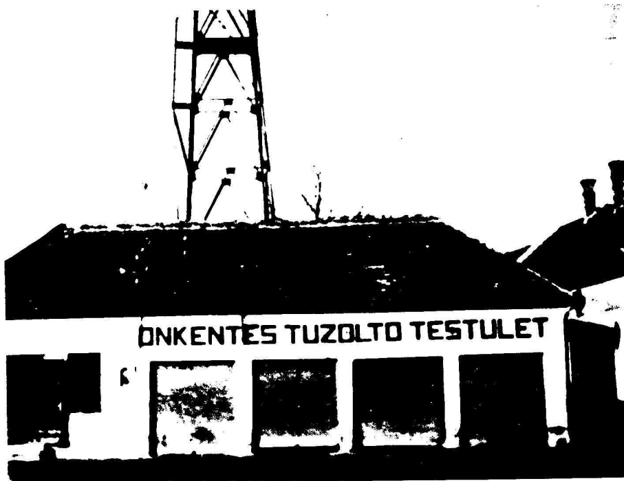
Az 1928-ban épített második szertár.