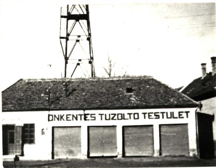
Az 1928-ban épített második szertár.