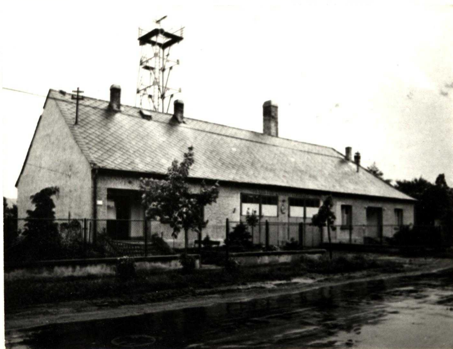
Az 1962-ben épített mai szertár.