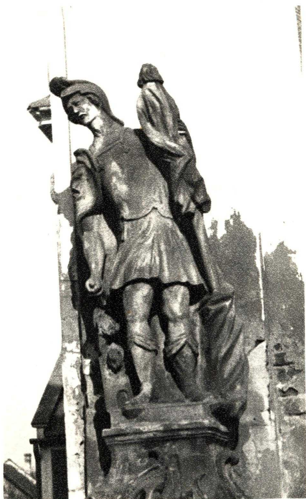
Szt. Flórián a tűzoltók védőszentje.