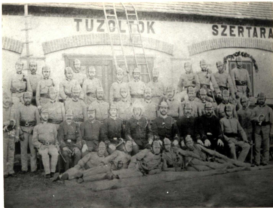
Az 1882-ben épített első szertár.