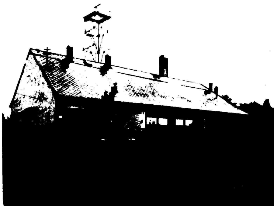
Az 1962-ben épített mai szertár.