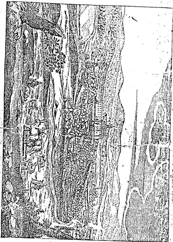
Abbildung der Lösung SENGROT in Ungarn 1605

NAGY-KANIZSA. NYOMATOTT FISCHEL FÜLÖP KÖNYVNYOMDÁJÁBAN 1897.