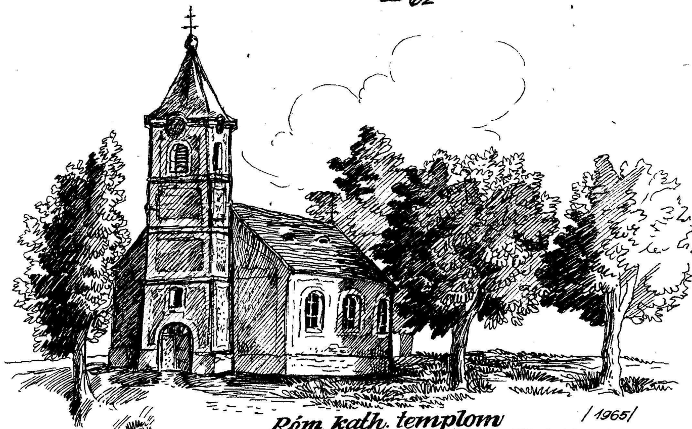
Róm. kath. templom