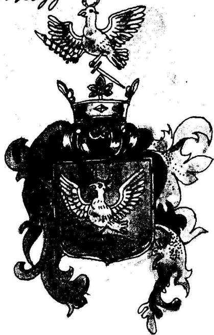
A SZEGEDY-CALAD NEMESI CÍMERE